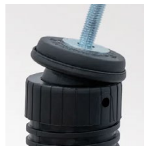
Regulowany kąt 0-15°